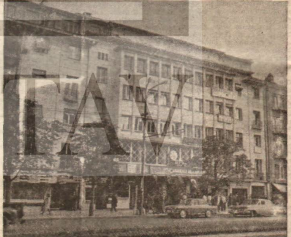
Kâzım Rüşti Güven'in meşhur «Büyük Sinema'sı».

Güven Sigorta nihayet büro açma yoluna gitmiştir. Ama bu arada acentelere lüzumsuz yere milyonlarca lira para kaptırmıştır. İktisadi devlet teşebbüsleri ise, yerli - yabancı sigorta şirketlerini ve aracılı zengin etmek için lüzumsuz yere yılda 50 milyon lira civarında prim ödemekte devam etmekte dirler.