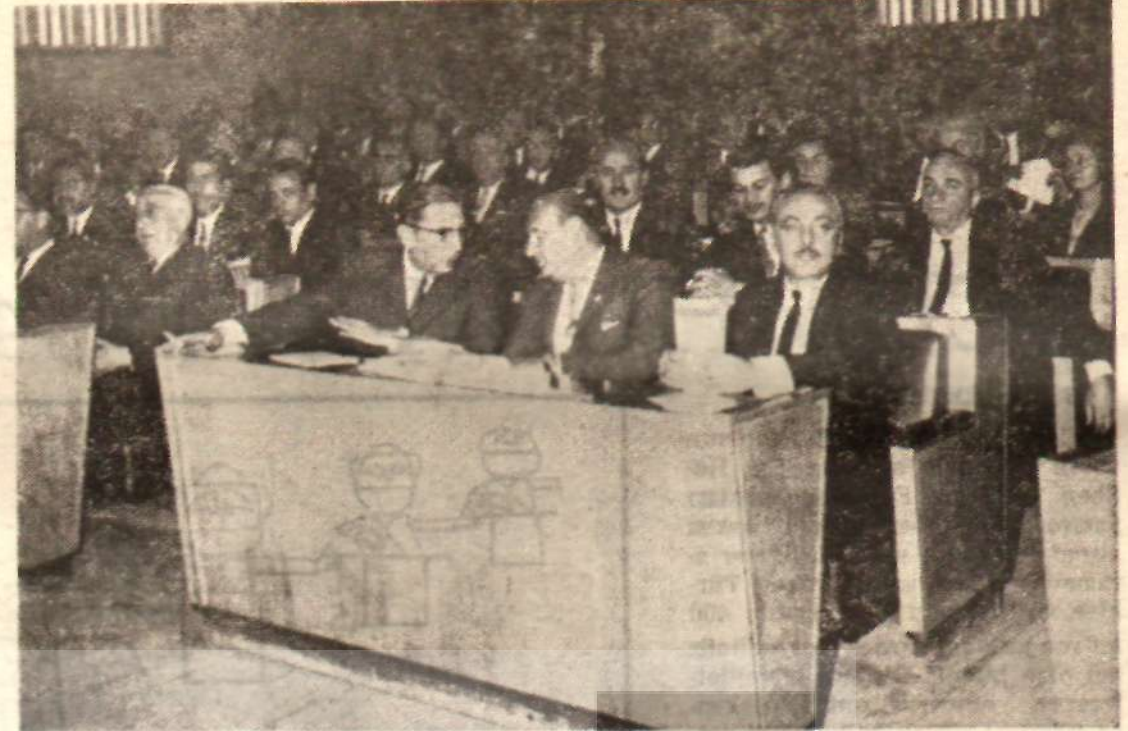
Başbakan Demirel AP Grup toplantısında Vazo, erken çaftadı...