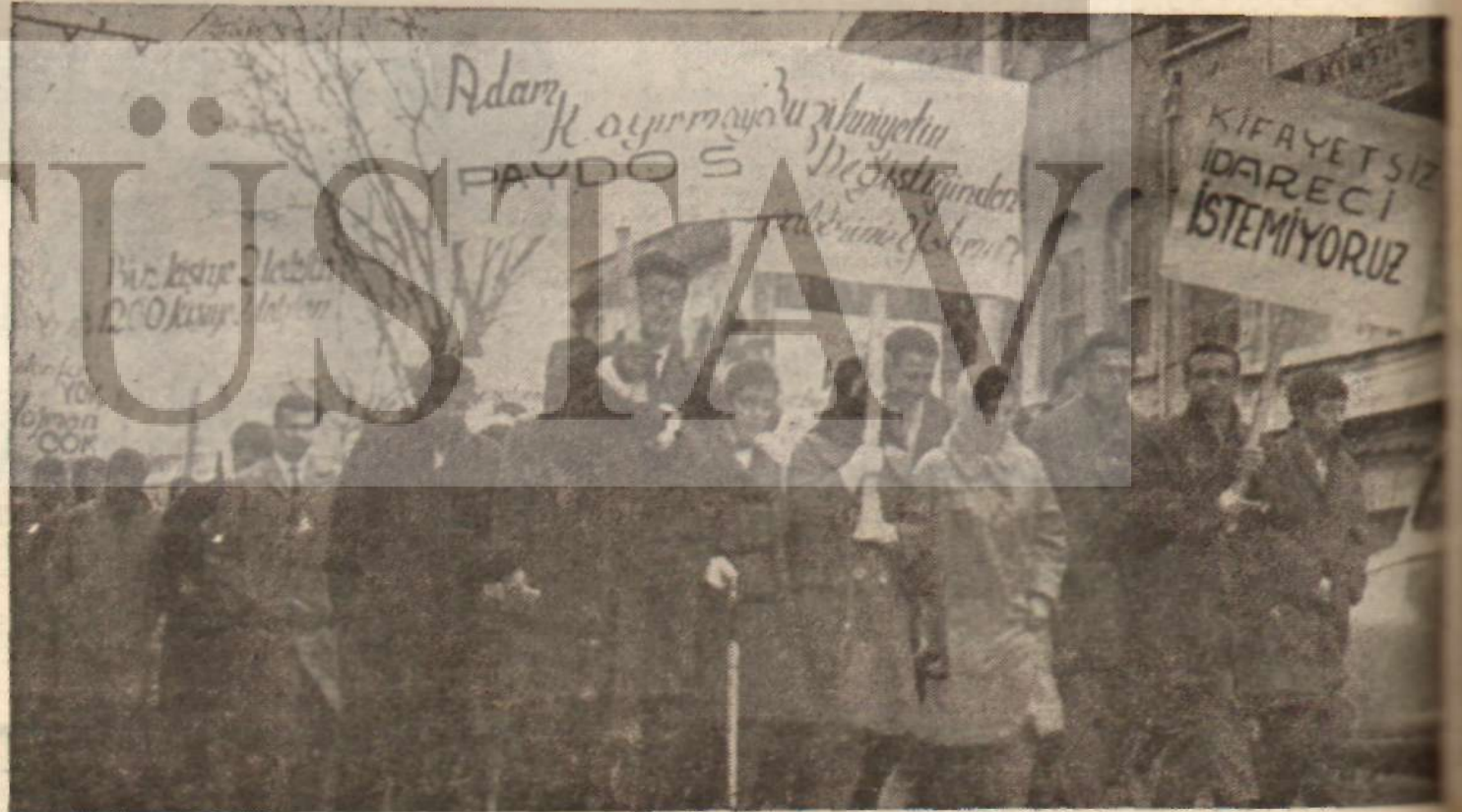
Üniversite gençliği öğretime karşı şikâyetlerini bir gösteri yürüyüşü ile açıklıyorlar.

Fakat bugün üniversite ve yüksek okullarda ne görüyoruz? Genellikle Kasım'da öğretime başlanıyor. Şubat ayı sömestr tatili, Marttan Mayıs sonuna kadar ders, Haziran-